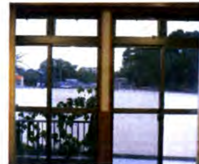
運動場が見渡せる大きな窓